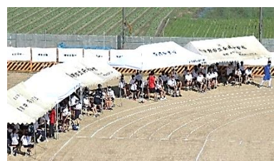
青少年指導員会さんより奇贈もあり、生徒席にテントを設置