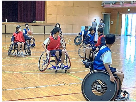
車いすバスケットの様子