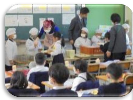
← 給食当番ががんばってます

そのような活動を通じて「あなたも大切、わたしも大切」といったあたたかい気もちを醸成していきます。気もちあったかタイムがあった後にはぜひ、「気もちあったかタイムどうだった？」とお子さんに聞いてもらえると幸いです。