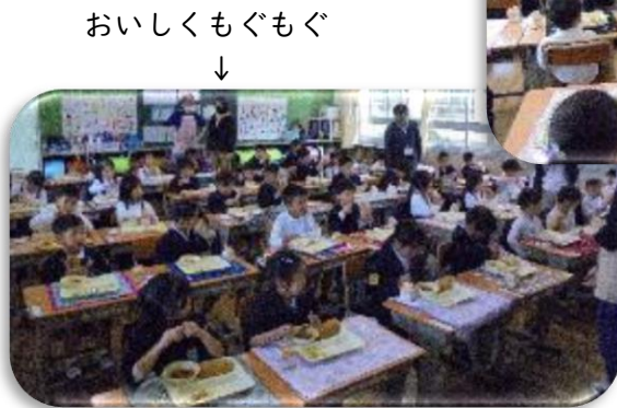
おいしくもぐもぐ