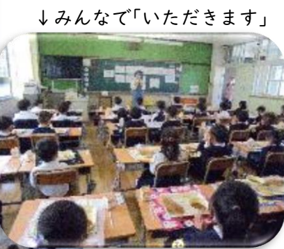
↓ みんなで「いただきます」