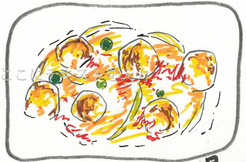
揚げ鶏の ウイグレット ソースがけ